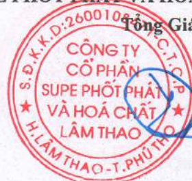
Phạm Quang Tuyền

(Các thuyết minh từ trang 09 đến trang 35 là bộ phận hợp thành của Báo cáo tài chính tổng hợp giữa niên độ này)